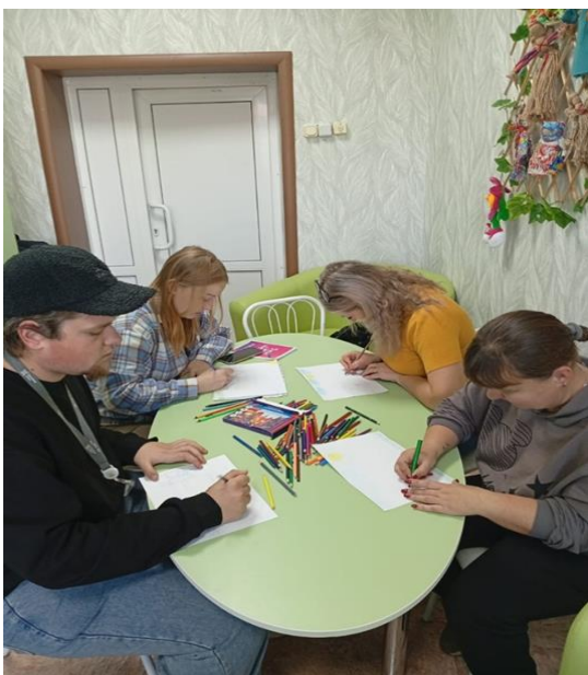
Занятие «Моя семья»